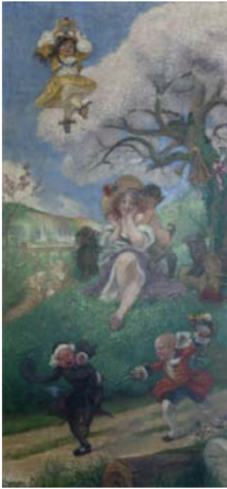
Adolphe Willette Le Printemps 1920 huile sur toile Collection particulière, Genève