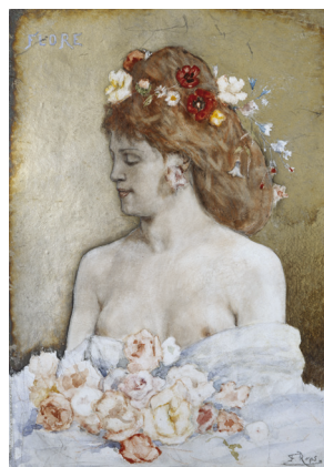
Félicien Rops, Flore, s.d. , Otterlo, Kröller-Müller Museum, inv. KM 107.152