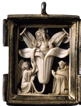
Pendentif en forme de diptyque, L'Annonciation, 15 e siècle. Paris, musée du Louvre, inv. OA52