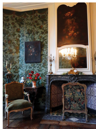
Salon aux toiles florales