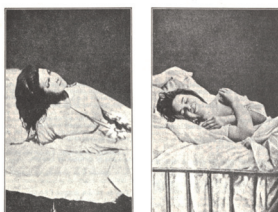
LES ATTITUDES PASSIONNELLES EN 1875