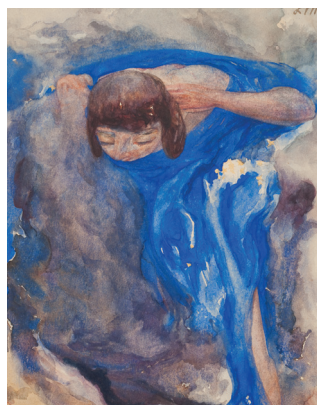
Lucie Maquet, Rêve , juillet/1914, aquarelle sur panneau en carton, 25,7 x 19,9 cm. Sammlung Prinzhorn, Heidelberg, inv. 3184