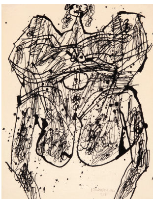
Jean Dubuffet, Corps de dame , 1950, lithographie, 27 x 21 cm. Coll. Ronny et Jessy Van de Velde, Anvers