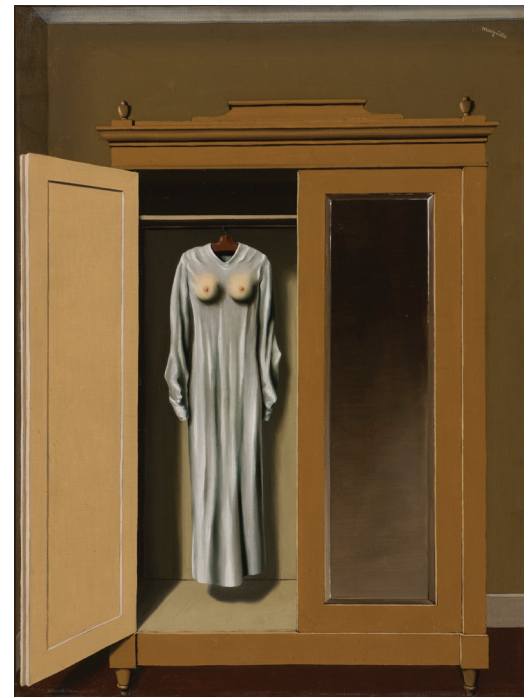
René Magritte, Hommage à Marck Sennett, 1932, huile sur toile, 81 x 116 cm. Coll. Ville de La Louvière, inv. P0220/1937.

Loss of control II neemt u dus mee voor een duik in de diepste roerselen van de mensenziel, en tast de grenzen en de perceptie van de kunst af. De werken waaruit deze tentoonstelling bestaat, zoomen uitgebreid in op de voorstellingen van de zinnelijkheid, de obsessie en het zelfbeeld... Van surrealisme tot asielkunst kwellen dezelfde vragen de kunstenaars die ze frontaal aanpakken, ongeacht hun eigen beleving en ervaring. Het lichaam, de liefde, de voorstelling van zichzelf en van de ander, zijn plekken waar men zich verliest. ... Ze maken dat hun scheppers de controle over zichzelf kwijt raken. Dat geldt ook voor de toeschouwers van wie de interpretaties verschillen naargelang van de tijd.