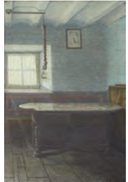
La Lumière qui fuse , 1903, huile sur toile. Coll. privée.

De catalogus gepubliceerd bij uitgeverij Liénart (Parijs) bevat nieuw wetenschappelijk onderzoek over de kunstenaar evenals een actuele inventarisering van zijn geschilderd en getekend werk.