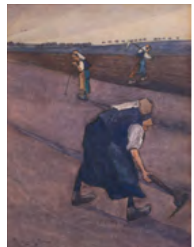
Ardennaises travaillant aux champs , s.d., aquarelle. Coll. privée