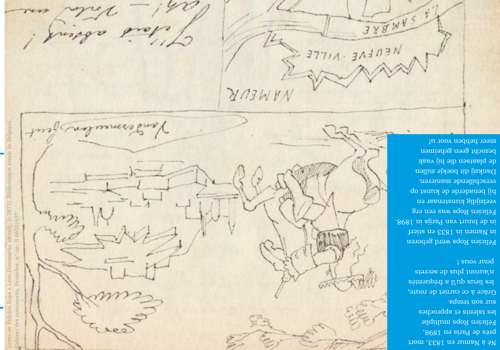
Lettre de Félicien Rops à Léon Dommartin (détail), [c.1871]. Bibliothèque royale de Belgique, Cabinet des manuscrits, Bruxelles, n° inv. II 6655/457.

Beschouwd als één van de mooiste barokgebouwen uit de 17 de eeuw in België. Félicien Rops bezocht de kerk samen met Charles Baudelaire in 1866.