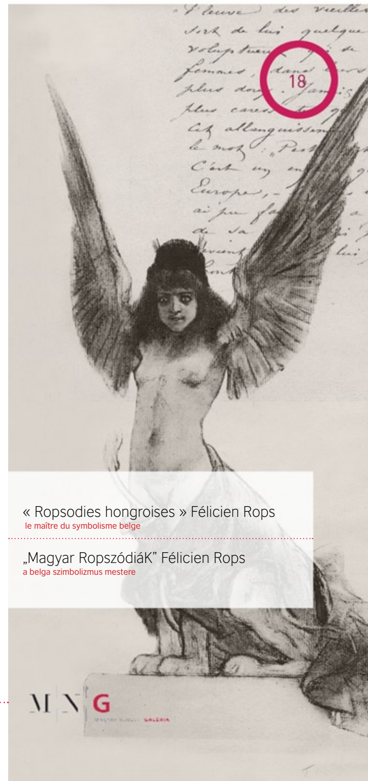
« Ropsodies hongroises » Félicien Rops le maître du symbolisme belge

Angol fordítás / Translation into English: Boros Attila Felelős kiadó / Publisher: Csák Ferenc főigazgató